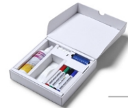
(STARTERKIT) STARTERKIT STARTERSET